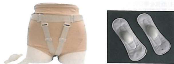
写真① 専用ホルダーに装着したシリコン製クッション

・骨盤臓器脱疾患 (POP) の症状を緩和する治療用具です。体内に挿入するものではありません。専用ホルダー(写真①)に固定したシリコンクッションによって、体外に脱出した臓器を押し戻します。専用のサポーターにて股間を引き上げるように固定します。臓器・膣粘膜に負担をかけず、生理用品と同じ要領で、ご自身で装着して頂くものです。 手術を希望しない方、リングベッサリーを希望されない方、薬爛で対応の困難な方、手術待ちでリングを外された方にお勧め下さい。(詳細はMTF-Webにてご確認ください)